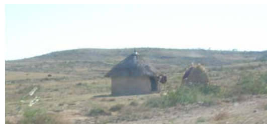
Nous découvrons les toukous, habitations traditionnelles aux toits de paille et murs en bois.

Les gens semblent moins miséreux et plus heureux qu'à Addis. Nous rencontrons de la pauvreté, mais pas la même misère que celle de bon nombre des habitants de la capitale.